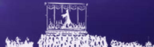
Imagen de la Virgen de los Dolores, por las calles del municipio, el viernes antes de Semana Santa.